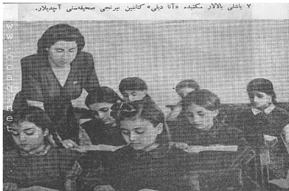
۷ یاغلی بالار مکتبده «آنا دیلی» کتابین یرنجی صحیفه سنی آجدیلار.

بوخالدا انگلستان حکومتی تهران دولتین رهبری قوام السلطنه الین آذربایجان ملی دولتین مذاکره ائدی و پیشه ورین آذربایجان ایچنین استقلاللی تانوماق اوچون زنجان اولکه سی اوستینده معامله ائدی و قرارداد باقلاپانندان سونرا، آذربایجان ملی مجلسی، آذربایجان ایالتینین انجمنینه دولاندى. مرکزی دولتی بوقرادادی سایمیریپ وامپریالیسمین دسیسه سی و کمیکله قشونی ایله زنجانا هجوم گه تیردی و خلقی و فرقه نین قوه لرینی منطقه ده قیردی و زنجان منطقه سی نی اشغال ائدی. تبریزی القماق اوچون چوروموش